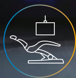
Centri di trattamento